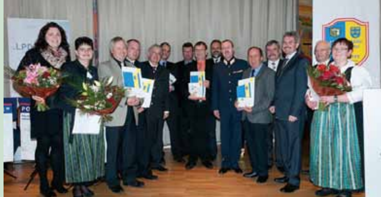
Gruppenfoto der Geehrten im Zusammenhang mit der Klärung von Einbruchdiebstählen.