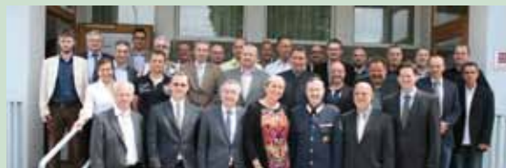
Gruppenfoto mit allen Geehrten