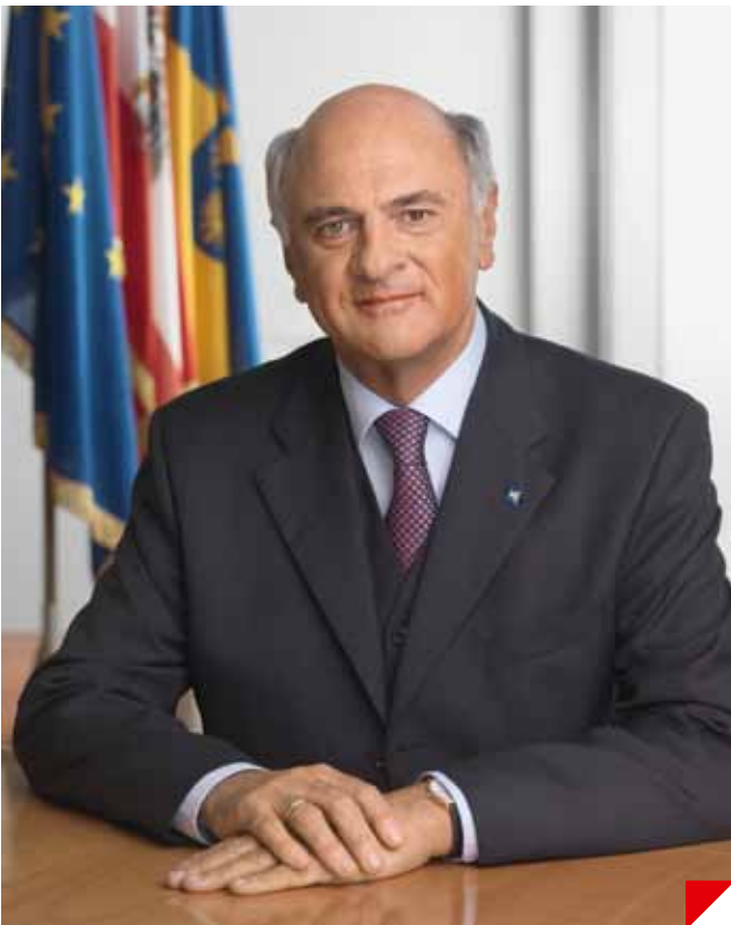
Dr. Erwin Pröll, Landeshauptmann

Die Exekutivbeamten leisten großartige Arbeit für die Sicherheit in unserem Land. Es muss uns aber klar sein, dass diese nicht allein von der Polizei gewährleistet werden kann. Jeder Einzelne muss seinen Teil beitragen, nicht zuletzt durch die Unterstützung der Polizistinnen und Polizisten. Ich bin daher sehr froh, dass das Verhältnis zwischen der Exekutive und der Bevölkerung ein so gutes ist. Eine wichtige Unterstützung für eine gelungene Zusammenarbeit leistet auch der Verein der Freunde und Förderer der Exekutive Niederösterreichs. Mit meinem Glückwunsch zum 40-Jahr-Jubiläum des Vereins verbinde ich ein aufrichtiges Dankeschön für die bisherigen Leistungen sowie die besten Wünsche für die Zukunft.