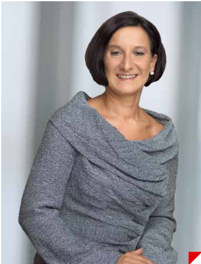
Mag.ª Johanna Mikl-Leitner, Bundesministerin für Inneres

Ich gratuliere der Gesellschaft der Freunde und Förderer der Exekutive Niederösterreich zu ihrem 40-jährigen Bestehen und ich danke der Gesellschaft für ihr Engagement, ihre Anteilnahme und ihre großartige Unterstützung der Polizei in Niederösterreich. Ich weiß, dass die Polizei und damit auch die Menschen in Niederösterreich auch in Zukunft auf ihre Unterstützung bauen können.