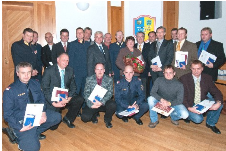
Gruppenbild aller Geehrten mit den Vertretern der Gesellschaft