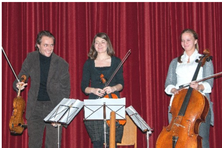
Streichertrio aus Purkersdorf