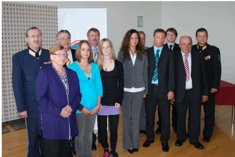
Die Vertreter des Vorstandes mit allen Geehrten