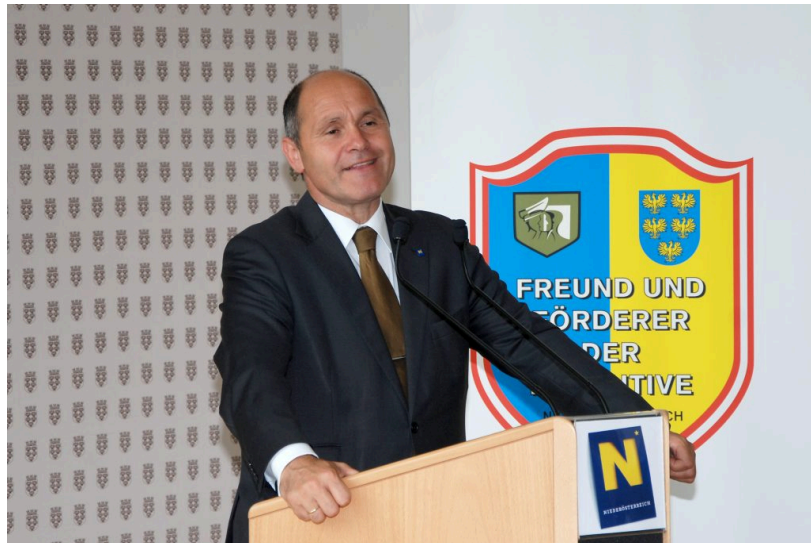
Landeshauptmann-Stellvertreter Mag. Wolfgang SOBOTKA

Am 17. Juni 2010 fand im Leopoldsaal im Haus 1a der Niederösterreichischen Landesregierung in 3100 St. Pölten eine Ehrungsfeier der Gesellschaft der Freunde und Förderer der Exekutive Niederösterreichs statt, bei der sowohl Bürgerinnen und Bürger, als auch Polizeibeamte des Landes Niederösterreich für ihre besonderen Verdienste um die Sicherheit im Bundesland geehrt wurden.