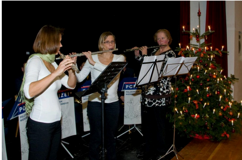
Querflötentrio der Musikschule Purkersdorf