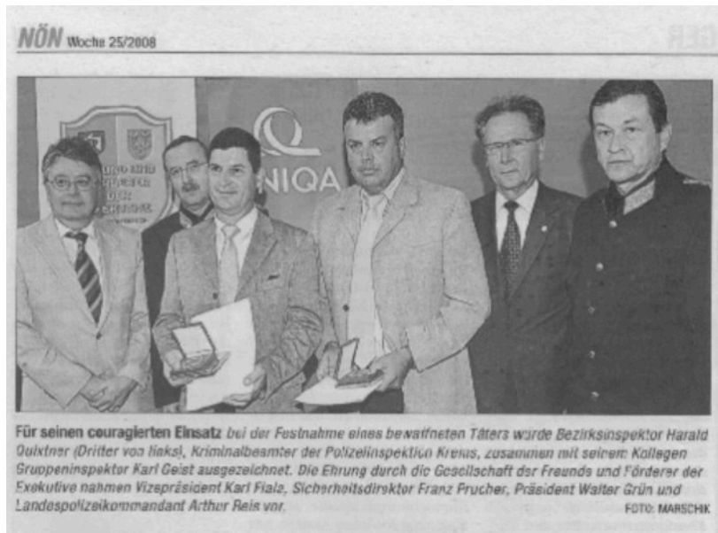
NÖN - Bericht