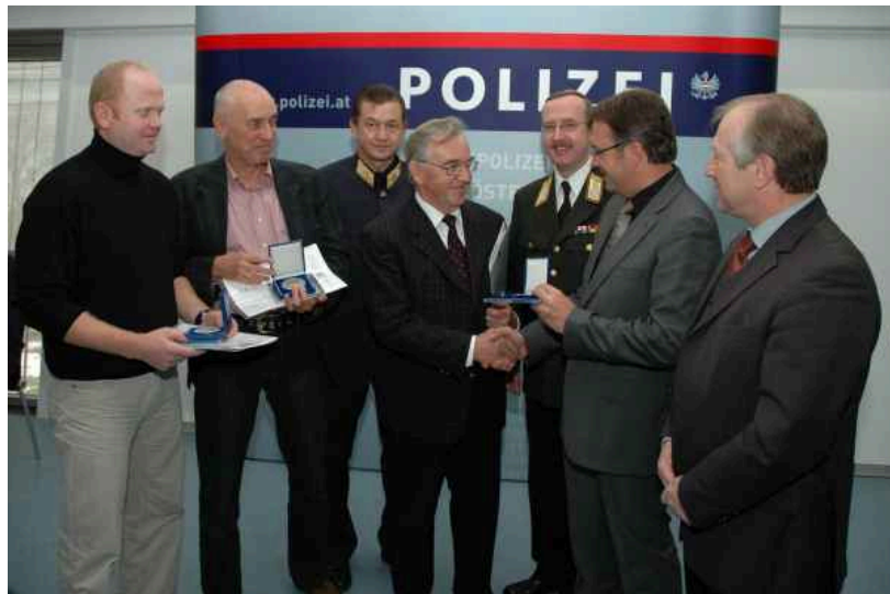
Der Bundesminister für Inneres persönlich gratulierte den couragierten Zivilisten

Gleich doppelten Anlass zum Feiern gab es am 23. November 2007 im Logistikzentrum des Landespolizeikommandos Niederösterreich in St. Pölten.