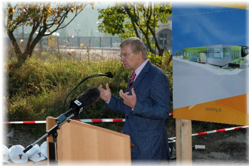
durch den Bürgermeister der Stadtgemeinde Lilienfeld