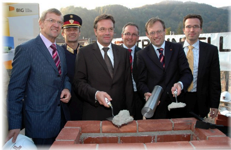
Bundesminister Günther Platter legte den Grundstein für das gemeinsame Polizei- und AMS-Gebäude