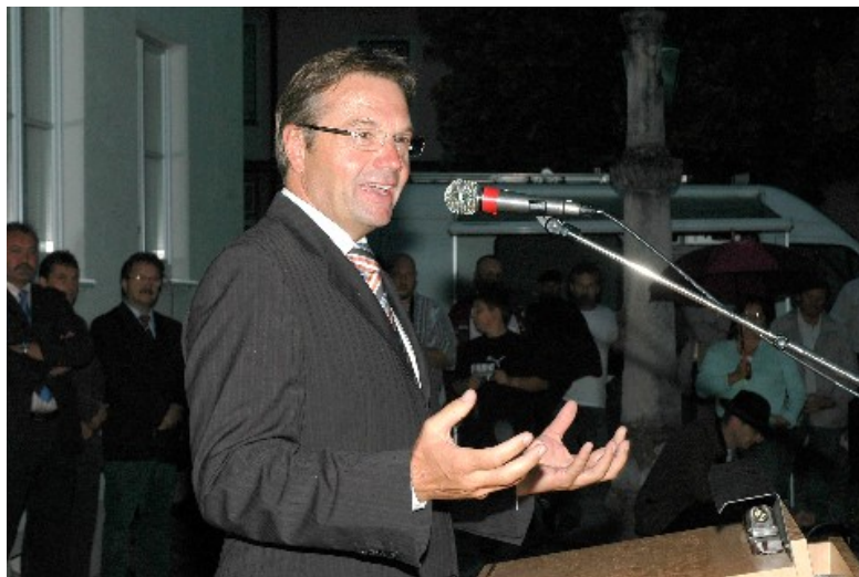
BM Günther PLATTER

Im Zuge der Feierlichkeiten zur ersten österreichischen Breitbandgemeinde feierte die Polizeiinspektion Grafenwörth, Bezirk Tulln, am 20. August 2007 die offizielle Eröffnung der großzügig erweiterten Dienststelle.