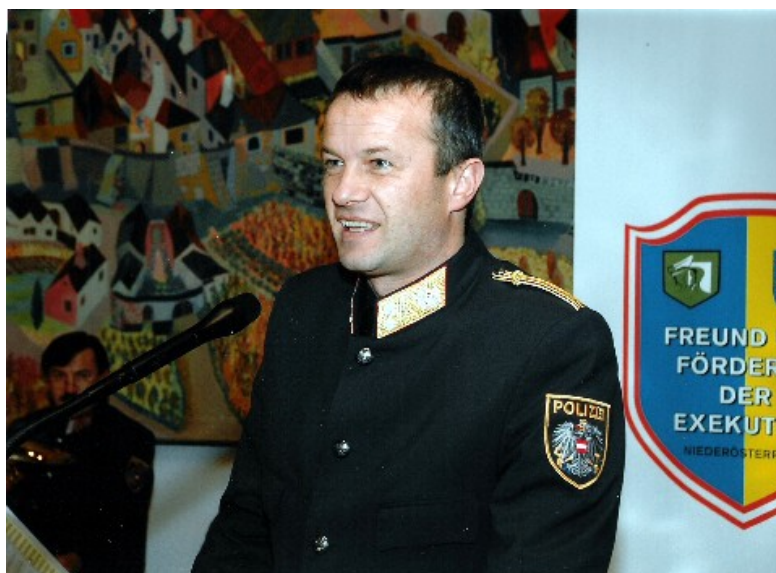
Landespolizeikommandant Stellvertreter GenMjr.

Ein Blumenstrauß für ihre Unterstützung der Gesellschaft