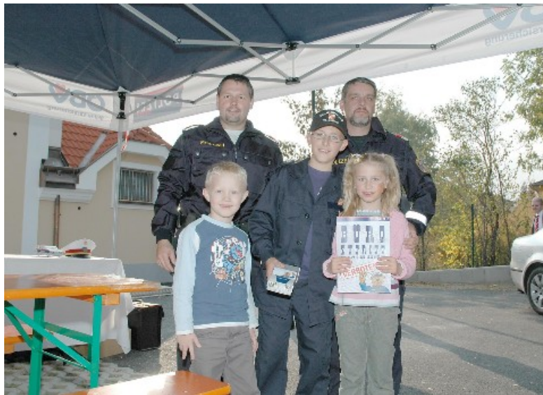
Beim Stand der Kinderpolizei kamen auch die Kinder auf ihre Rechnung